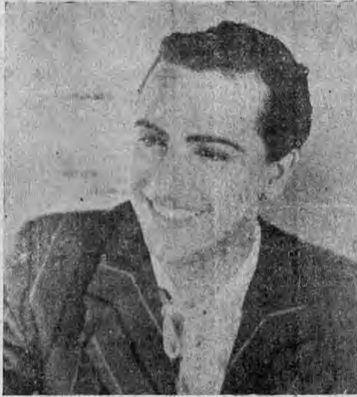
HUGO DEL CARRIL EN PERSONA Y EN PELICULA!!